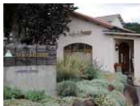
Mihari 504-6, Toumi-shi, Nagano-ken http://www.a-fromage.co.jp/