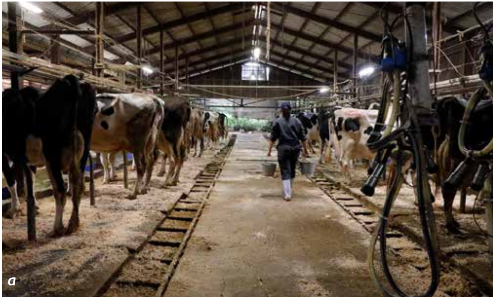
a. Il y a 23 vaches, dont 7 brown swiss. b. L'étable est située au pied de la montagne. En 1993, un système de retenue d'eau a été installé. La ville de Kobayashi est très fière de son eau minérale naturelle. « D'abord il faut du bon lait », c'est le conseil de son ancien maître à la laiterie.