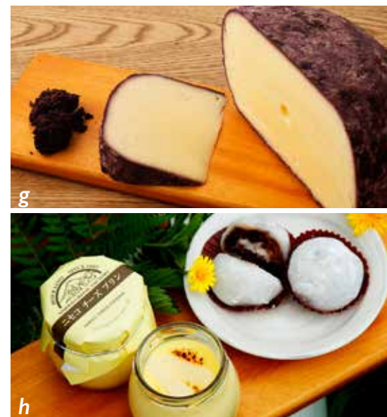
g. Gouda trempé dans du marc de raisins rouges. h. Daifuku (gâteau traditionnel japonais) au fromage blanc. Crème dessert au gouda. i. Bleu « kû » aromatisé à la lie de saké. j. Caciocavallo et fromage à déchirer en lamelles.