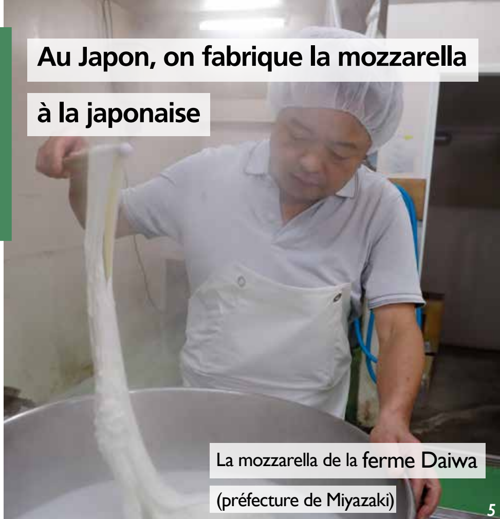
La mozzarella de la ferme Daiwa (préfecture de Miyazaki)