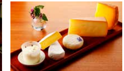
c. Cave souterraine en pierre fines naturelles [pierre à chaux de Sapporo] d. Fromage « Shintoko » qui rappelle le comté français.

Mais le succès n'était toujours pas au rendez-vous. 1998 sera un tournant important pour lui : il gagne le grand prix du « All Japan National Cheese Contest ». C'est sa raclette délicate qui a été choisie !