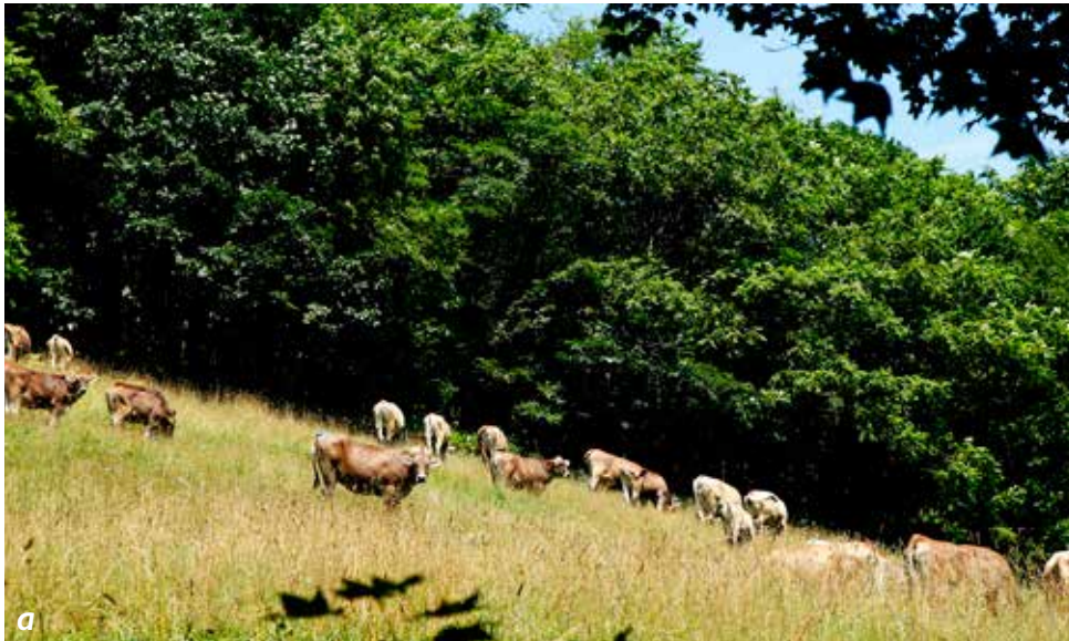
a. Les vaches broutent l'herbe de Tokachi et passent la plupart de leur temps dans les prés.