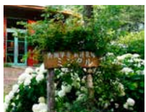
Aza Sintoku 9-1, Shintoku-cho, Kamikawa-gun, Hokkaido http://www.kyodogakusha.org