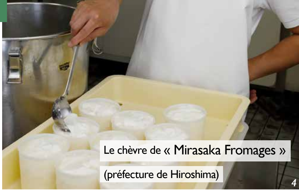
Le chèvre de « Mirasaka Fromages » (préfecture de Hiroshima)

Avec du lait de chèvres heureuses, on fabrique un fromage au goût pur