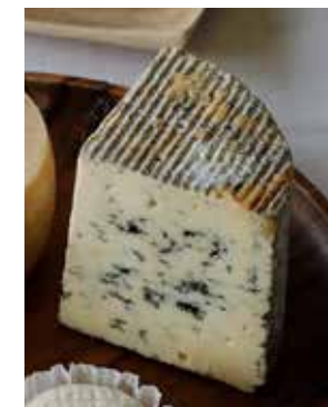
Atelier de fromage