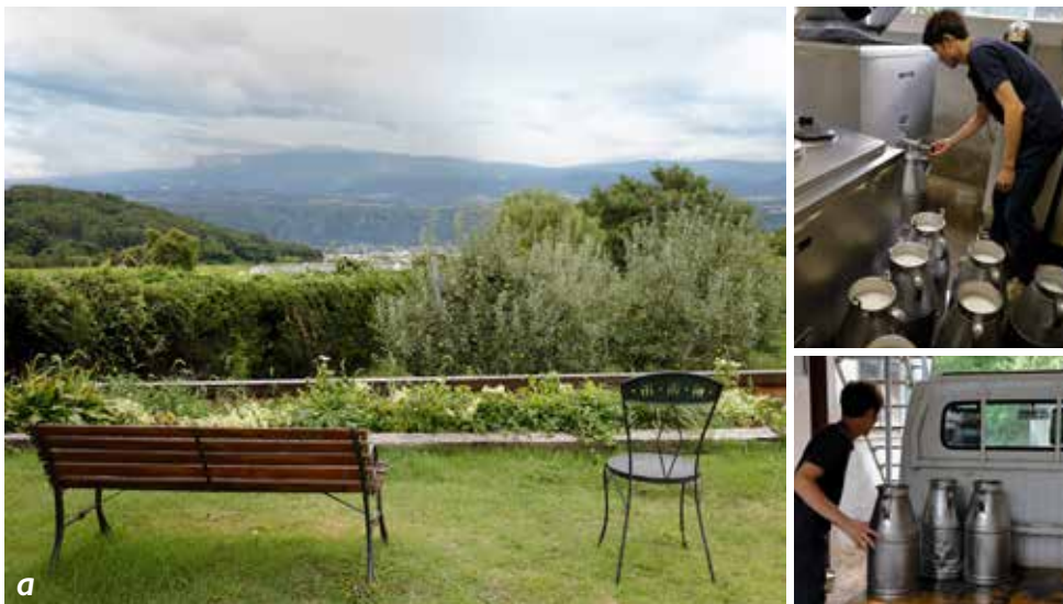
a. De la boutique perchée sur une colline à plus de 900 m d'altitude, on peut contempler la nature. Quand il fait beau, on voit même le Mont Fuji. b. Dans nos pâturages, il y a des brown swiss, des jersiaises et des holsteins. c. Fromage à pâte mi-dure qui est leur production principale. Une meule pèse 2 kg. On en produit entre 1500 et 2000 dans l'année.