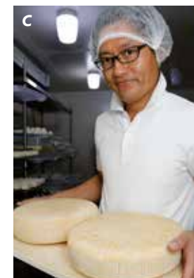
c. Canestrato d. Raclette e. Corbeille de bambou pour les fleurs. f. « Miyoshi no ukai » (chèvre) g. « Fuji-san 'kin' [or] » (chèvre)

L'élevage laitier de Matsubara est appelé « Yamachi-rakunô » (élevage laitier en pays montagneux) et les animaux broutent des herbages naturels et non des aliments concentrés. Le rendement de la production de lait n'est donc pas nécessairement élevé mais grâce à la décomposition rapide des matières fécales, les herbes du pré repoussent vite, ce qui permet une utilisation cyclique des pâturages. Après avoir trouvé les collines adéquates pour son projet, il lui a fallu deux ans pour convaincre les habitants de le laisser faire. En mal de financement, il a étudié les techniques de sylviculture en autodidacte pendant 2 ans. Quand il les a enfin maîtrisées, il a commencé à défricher les collines par lui-même.