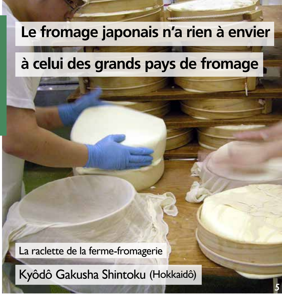
La raclette de la ferme-fromagerie