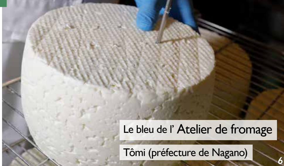
Le bleu de l'Atelier de fromage