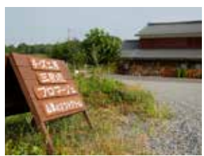
Nika 1617-1, Mirasaka-cho, Miyoshi-shi, Hiroshima-ken http://www.m-fromage.com