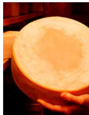
Ferme Kyôdô Gakusha