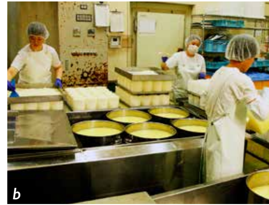
b. Fabrication d'un fromage à pâte molle fleurie du même type que le camembert. La fromagerie a adopté le système HACCP.