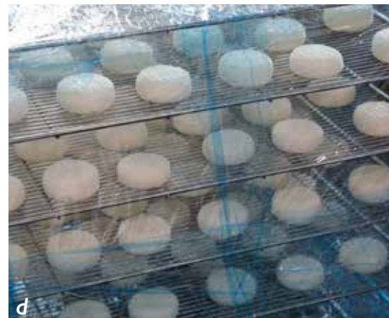
d. Le « Kokon » est un fromage doux et crémeux qui continue à fondre en bouche. Il a gagné le premier prix au concours international en 2017.

Quand on fabrique différents types de fromages dans la même fromagerie, comme c'est le cas pour l'Atelier de Fromage, le contrôle est très difficile car les différents microorganismes se croisent à l'inté-